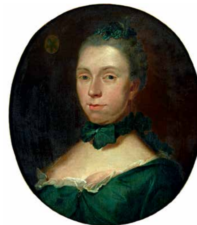
Portret van Margaretha Berck. Cornelis van Cuylenburg II, 1802

Weliswaar zitten er enkele tekeningen in het album die Zuidwind afbeelden te midden van het boerenland,