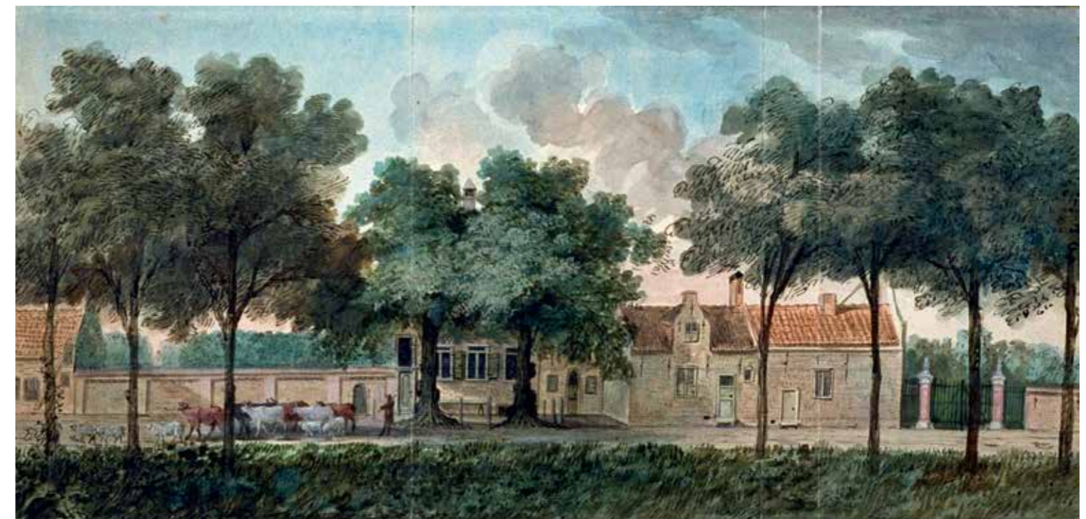
Het huis Endeldijk gezien vanaf de Mariëndijk. Dionys van Nijmegen, 1790