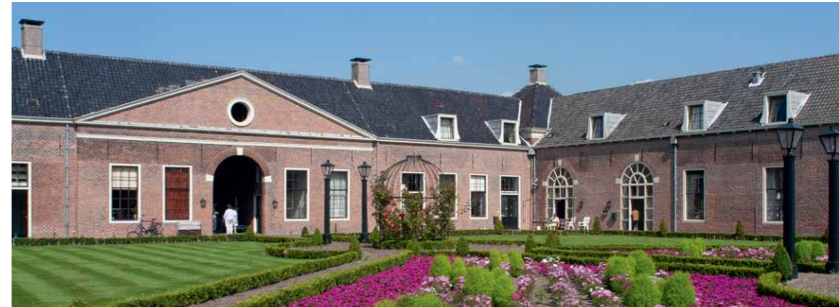
De Nederhof van het Huis Honselersdijk.

Wel bleef de strook langs de duinen bij Loosduinen en Monster nog lang een landelijk aanzien houden en daar waren dan ook tot in de twintigste eeuw de nodige buitenplaatsen te vinden. Toenemende druk door verdere groei van de tuinbouw enerzijds en stadsuitbreiding van Den Haag anderzijds maakten uiteindelijk dat buitenplaatsen in handen kwamen van de gemeente en projectontwikkelaars en plaatsmaakten voor woningbouw. Tegenwoordig zijn in het Westland alleen hier en daar nog kleine restanten van buitenplaatsen te vinden: een paar hekken, een laantje, een sloot of een naam. Ze zijn getuigen van een cultureel verschijnsel dat eeuwenlang een stempel op de streek drukte en deze zijn glans gaf.