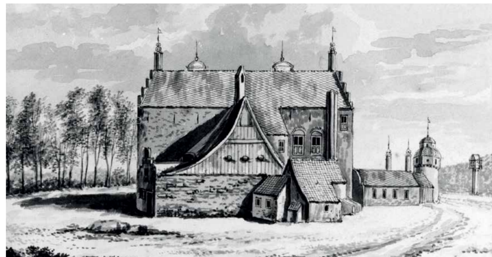
Het Hof van Wateringen achterzijde met duiventoren genaamd Rapenburgh (rechts). Abraham Rademaker, omstreeks 1718-1730