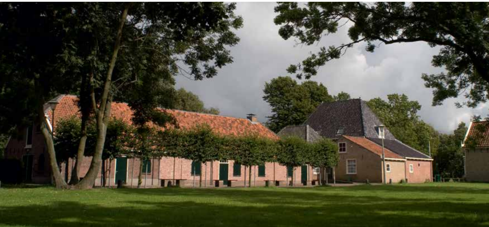
De huidige Hofboerderij. Foto: Ron Nieuwenhuizen 2006

De gemeente beziet nu de mogelijkheden om De Hofboerderij op te knappen en in gebruik te geven aan een stichting, waardoor de diverse verenigingen meer slagkracht krijgen in de benutting van deze unieke locatie.