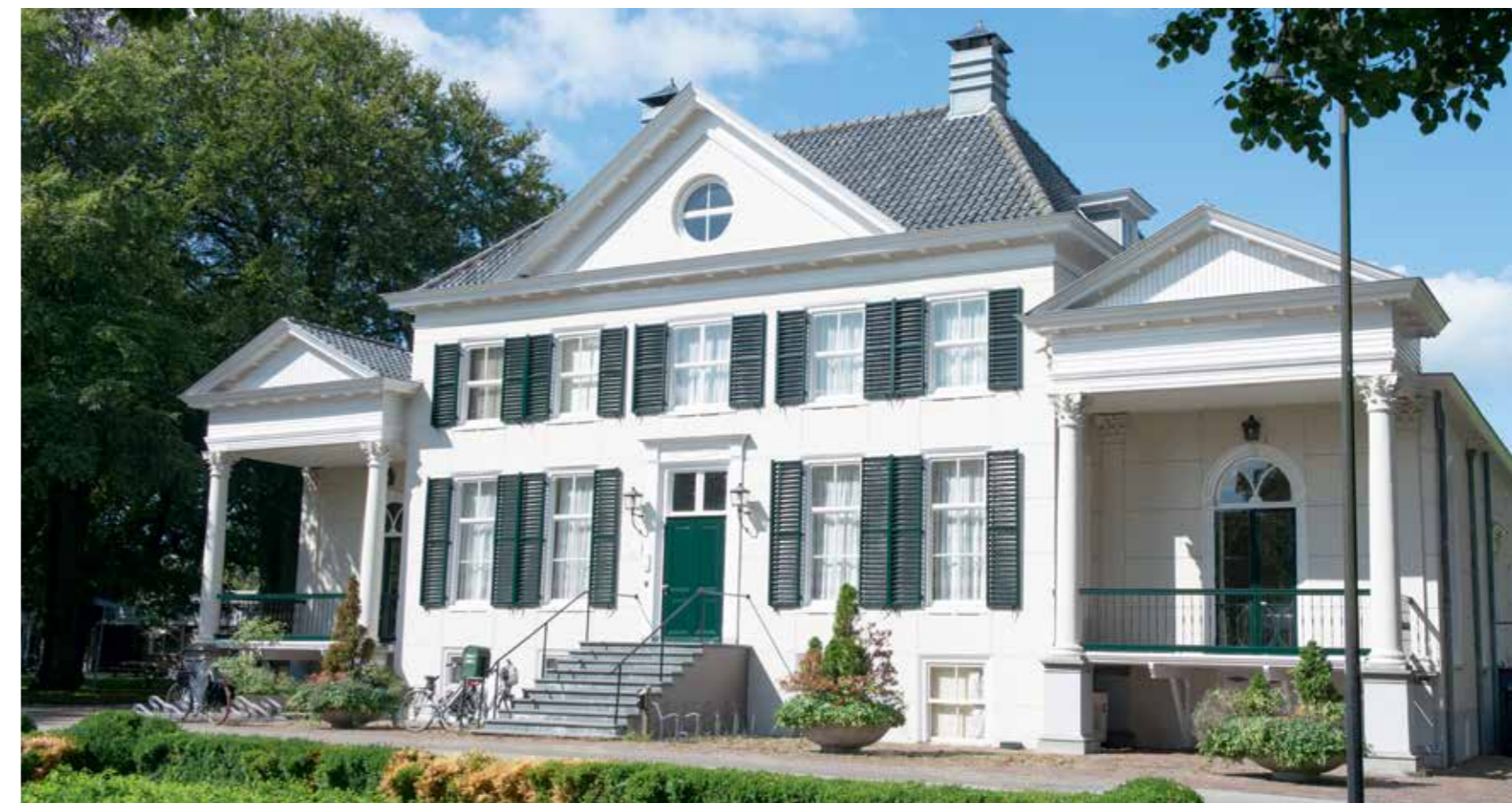
Oud Rozenburg. Foto: Ron Nieuwenhuizen 2018