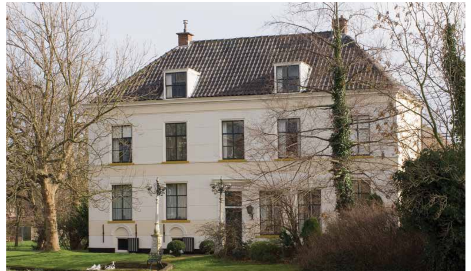
Suydervelt. Foto: Ron Nieuwenhuizen 2007

De landerijen waarop later Suydervelt zou verrijzen werden in 1608, 1609 en 1610 verworven door de jon-