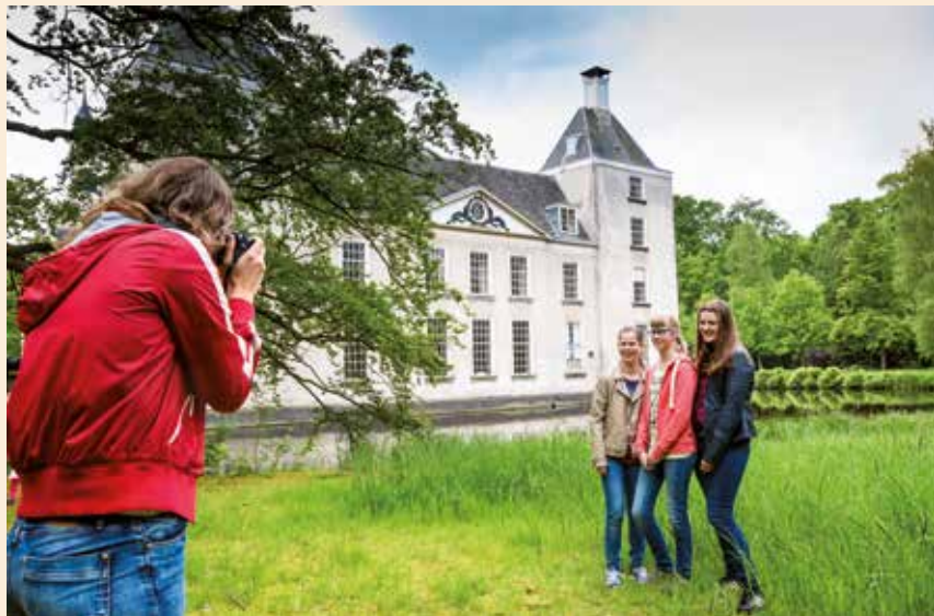
Warmond is een fotogenieke buitenplaats.

Vroenhof (zie blz. 61) en Oostergeest (blz. 59).